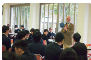
高校生交流会の様子