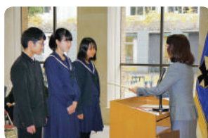
表彰される高校生たち